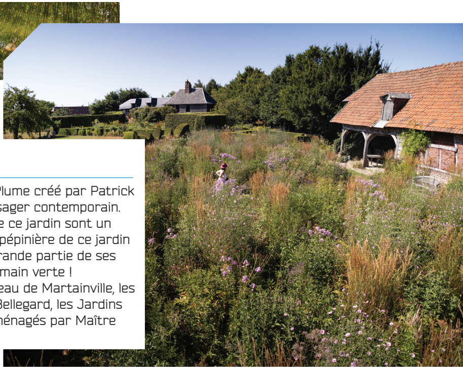
Jardin Plume

À proximité, découvrez le Domaine de Bois-Hérault, le Jardin des Sculptures du Château de Bois-Guilbert, le Jardin du Mesnil et Parc botanique de Bray à Montérolier, créé par Philippe et Catherine Quesnel, ou un peu plus loin, le Parc de Clères, le Jardin Agapanthe, le Parc du Centre d'art contemporain de la Matmut Daniel Havis, le Parc du Château de Bosmelet.