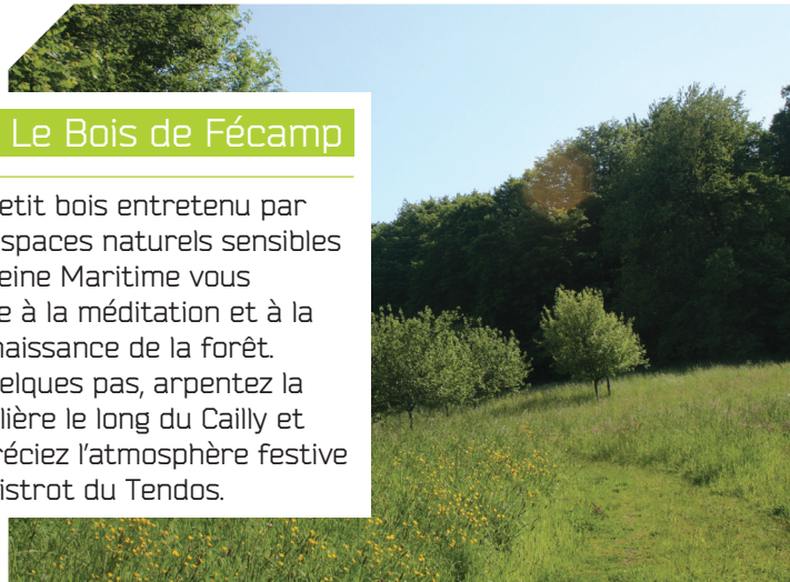
© OT Normandie Caux Vexin - Fontaine-le-Bourg

Ce petit bois entretenu par les espaces naturels sensibles de Seine Maritime vous invite à la méditation et à la connaissance de la forêt. À quelques pas, arpentez la roselière le long du Cailly et appréciez l'atmosphère festive du bistrot du Tendos.