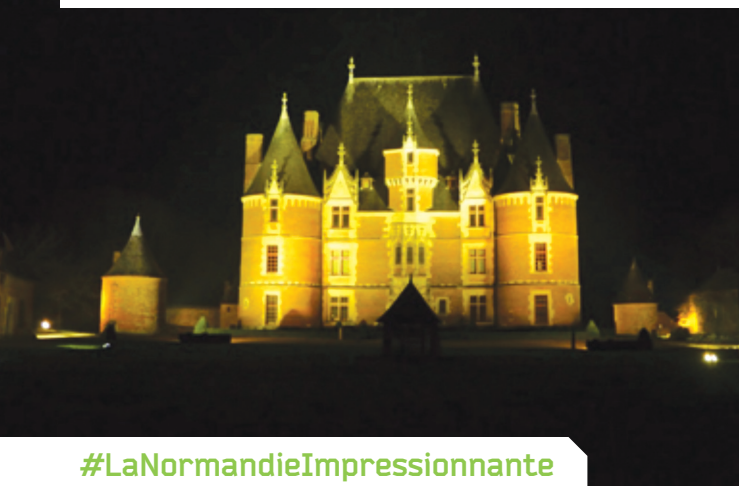
château de Martainville

www.normandie-caux-vexin.com/fr/evenements/