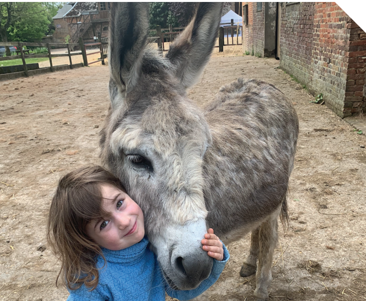
© OT Normandie Caux Vexin - Bois-Guilbert

Depuis Montigny, découvrez la magnifique forêt de Roumare et suivez la piste du loup. Restaurez vous au relais de Montigny ou au Clos de la Vaupalière.