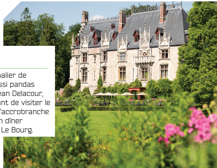
© Thomas Boivin - Parc de Clères

Vous pourrez ensuite remonter le temps grâce aux objets exposés au Musée des Traditions et Arts Normands, dans le célèbre Château de Martainville, commandité par Jacques Le Pelletier et premier château Renaissance de Seine-Maritime.