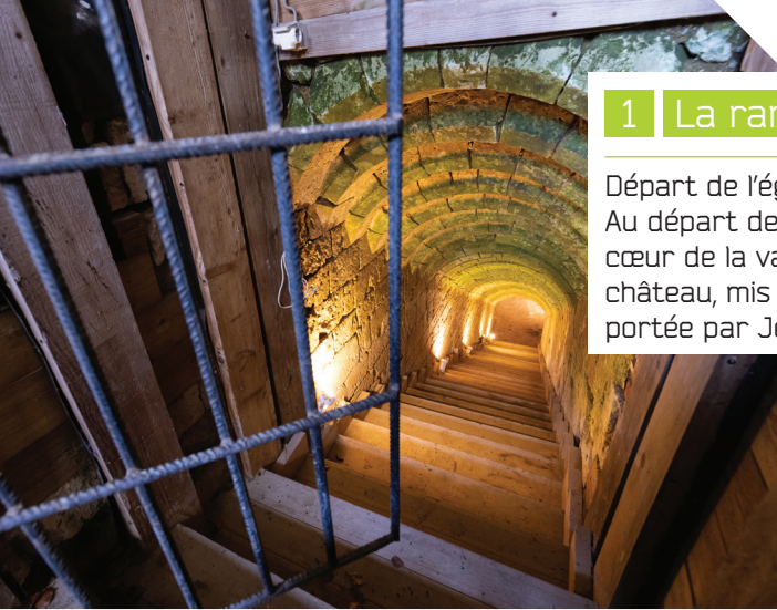
© Thomas Boivin - Château de Blainville-Crevon