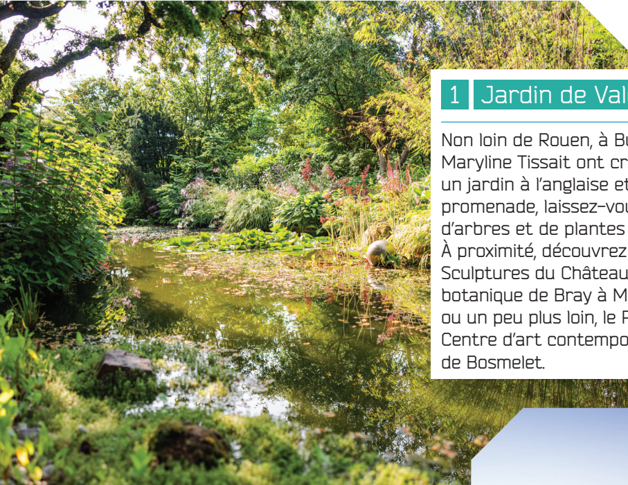
© Thomas Boivin - Jardin de Valérianes